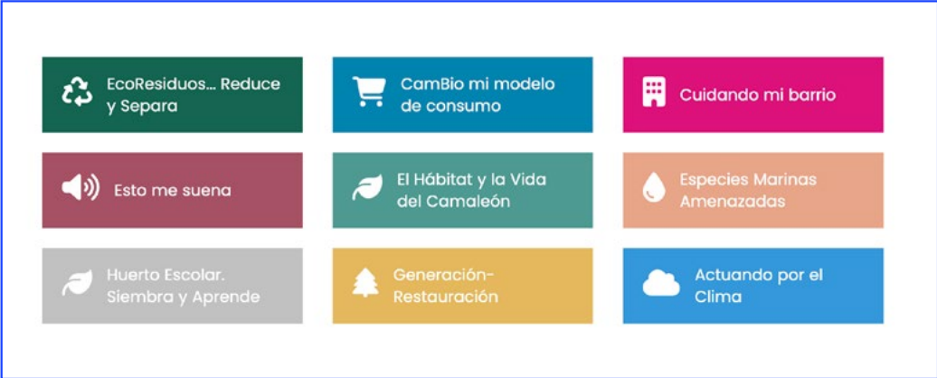
Figura 1: Eventos sostenibles celebrados en la ciudad de Málaga 2019-2023

Fuente: Programa Municipal de Concienciación Ambiental